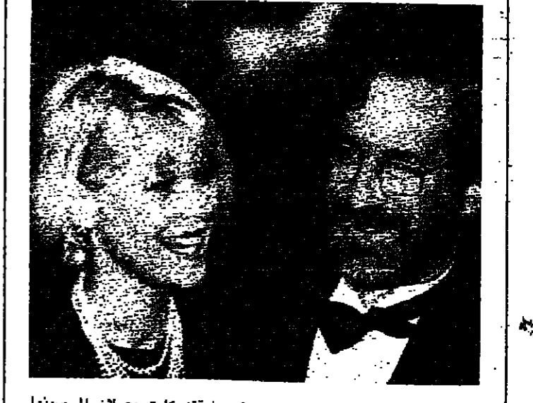
المخرج السينمائي ستيفن سبيلبرغ ورفيقته كايت يصلان الى سينما اميركي في ساحة ليستر في لندن، لحضور العرض الأول لفيلمه الجديد «العودة الى المستقبل ٣».